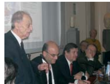
Από την παρουσίαση του βιβλίου

σημειώνει η Μαντώ Νταλιάνη στο τέλος της πρώτης ιστορίας γύρω από τη ζωή του Αλέξη (ψευδώνυμο) , του κατάξανθου εκείνου μωρού που συνάντησε στις φυλακές Αβέρωφ, στις 13/4/1949.