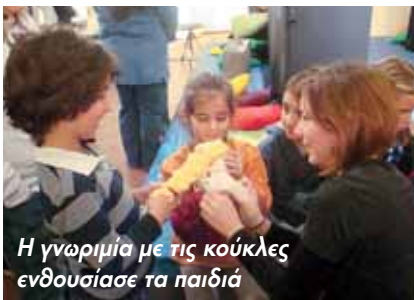
Η γνωριμία με τις κούκλες ενδουσίασε τα παιδιά

10ήμερο εκδηλώσεων για μαθητές Α΄ βάρθμιας και Β΄ βάρθμιας εκπαίδευσης, γονείς, εκπαιδευτικούς με στόχο την ευαισθητοποίηση και την ενημέρωση για το φαινόμενο της ενδοσχολικής βίας (bullying) και της βίας μέσω διαδικτύου (cyber bullying) μεταξύ των μαθητών.