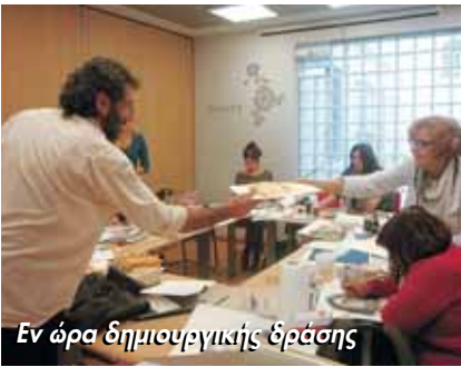
Εν ώρα δημιουργικής δράσης

Τ ο σχολείο μου, η φυλακή μου. Κάθε χρονιά, μια καταδίκη, λέει ο ήρωας του βιβλίου για το δράμα που ζει, καθώς είναι ένα από τα θύματα ενδοσχολικής βίας. Το bullying, η υπόγεια βία που ασκείται μεταξύ παιδιών και εφήβων στο χώρο του σχολείου (στα διαλείμματα, στα αποδυτήρια, στα σχολικά, στο σχολάσμα) είναι ένα εξαιρετικά επίκαιρο ζήτημα.