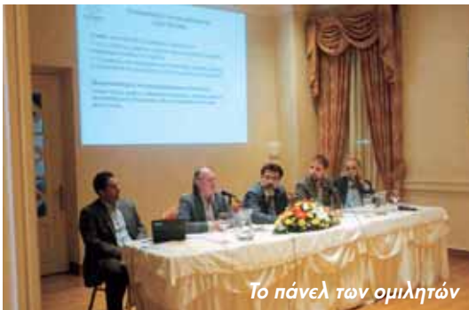
Το πάνελ των ομιλητών