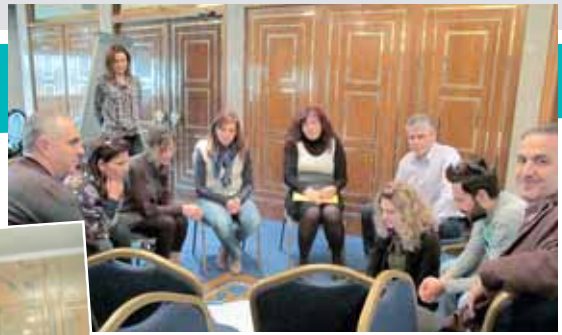
Οι εκπαιδευτικοί συμμετέχουν σε βιωματικές δραστηριότητες

Χρησιμοποιείστε το QR scanner του κινητού σας για να διαβάσετε και να αποθηκεύσετε τα στοιχεία