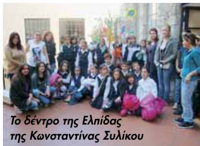
Το δέντρο της Ελπίδας της Κωνσταντίνας Συλίκου