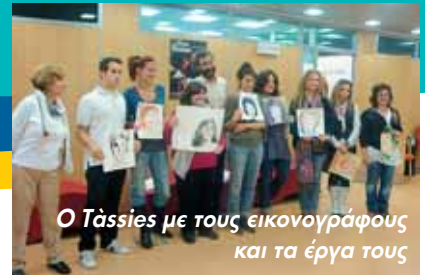
Ο Tàssies με τους εικονογράφους και τα έργα τους